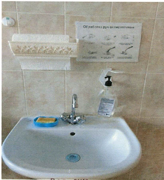
Фото 1. На средство гигиенической обработки рук приклеены маркировки и инструкции по их применению