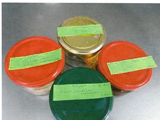
Фото 5. Суточная проба на сливочное масло, бутерброд с сыром, печенье отбирается в полном объеме