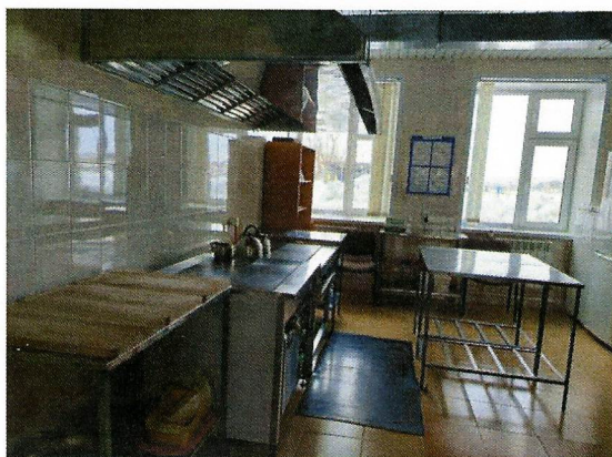
Фото 4. На отдельных производственных столах и разделочном инвентаре обновлены маркировки и используются строго по назначению. С поваром, которая на столе для сырого мяса готовила овощные блюда, проведен повторный инструктаж.