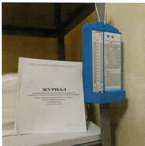
Фото 6. Складское помещение оборудовано прибором для измерения влажности и температуры воздуха, показатели регистрируются в журнале учета .