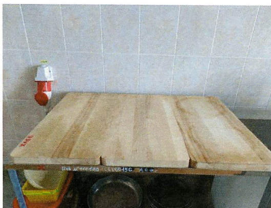
Фото 3. Металлическое покрытие производственного стола, предназначенное для работы с хлебом, заменено на деревянное покрытие