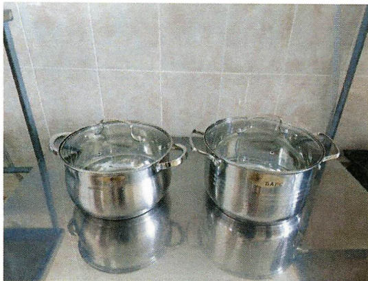
Фото 2. Эмалированные ведра с механическими повреждениями, сколами заменены на новые оцинкованные кастрюли